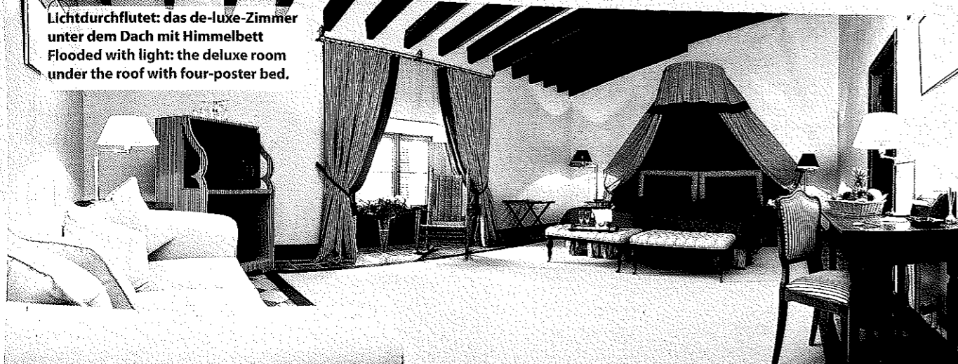
Lichtdurchflutet: das de-luxe-Zimmer unter dem Dach mit Himmelbett Flooded with light: the deluxe room under the roof with four-poster bed.